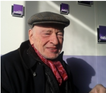
Edgar MORIN philosophe

avec le collectif ROOSEVELT 2012 fondé par